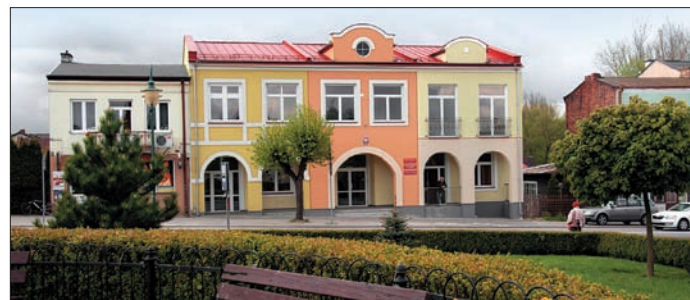
Budynek biurowo-administracyjny Urzędu Miejskiego w Urzędowie

Rok 2016 to okres przejściowy pomiędzy okresem programu 2007-2013 i 2014-2020, to czas intensywnych starań ze strony Urzędu o pozyskanie funduszy zewnętrznych, w tym głównie unijnych oraz realizacji zadań wynikających z budżetu gminy na 2016 r.