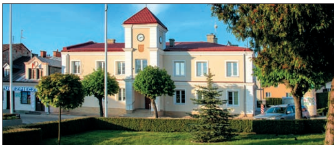
Siedziba władz Miasta i Gminy Urzędów