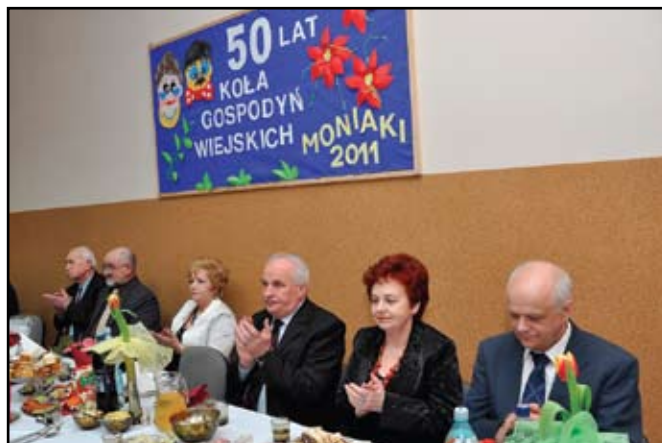
Goście podczas jubileuszu

Po części oficjalnej odbyło się krótkie przedstawienie teatralne przygotowane przez panie z Koła mówiące o życiu w wiejskiej społeczności, o ludzkich wadach i zaletach, wszystko w humorystycznej konwencji, na wesoło. Na takiej uroczystości nie mogło zabraknąć pysznych potraw przygotowanych przez kobiety z KGW w Moniakach. Przystąpiono więc do biesiady połączonej z zabawą taneczną.