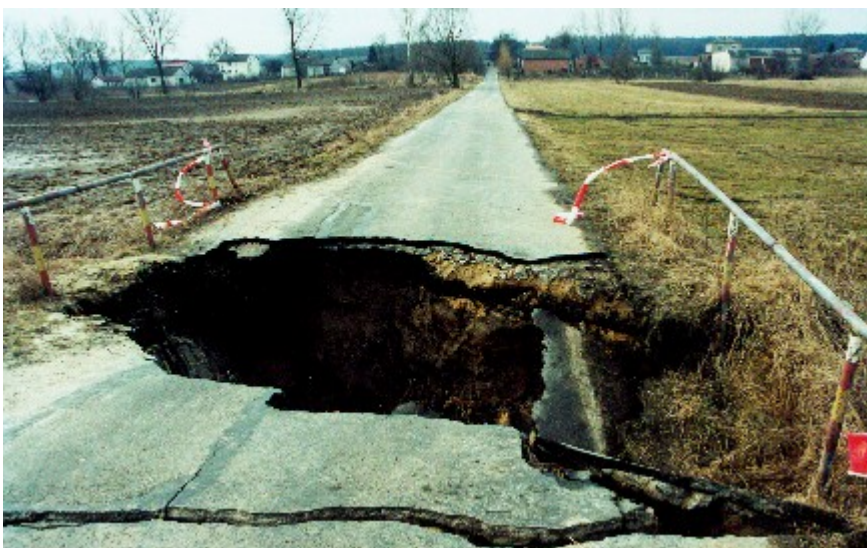
Przepust na drodze Kolonia Moniaki – Majdan Moniacki uszkodzony i po odbudowaniu