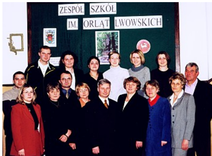
Grono pedagogiczne szkoły