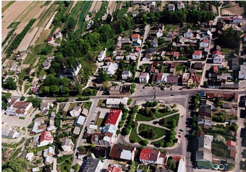
Centrum Urzędowa „z lotu ptaka”