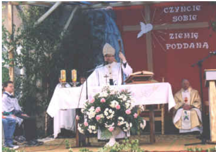
Mszę św. odprawiona przez Ks. Arcybiskupa Józefa Życińskiego

Pierwszy dotyczył zaliczenia tego obszaru do terenów górzystych, a taka decyzja oznaczała płacenie niższych podatków. Pomimo wielkiego zaangażowania i włożonego wysiłku w to zagadnienie w efekcie końcowym zabrakło 0,2 punktu, aby tak się stało.